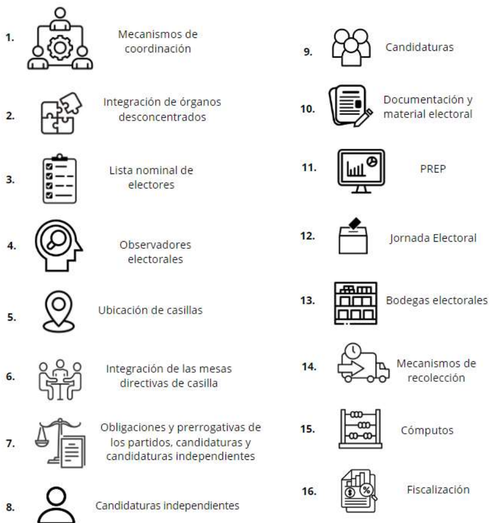
Imagen 1. Subprocesos del Proceso Electoral Local Extraordinario

De conformidad con el artículo 74 del reglamento, es esencial que los Calendarios de Coordinación establezcan los temas en los que el INE y los OPL deben de colaborar para la celebración de elecciones extraordinarias. Para este fin, tomando como base experiencias anteriores, se definieron 16 subprocesos esenciales en la organización de los Procesos Electorales Locales Extraordinarios 2024, a los que se les dará seguimiento puntual: