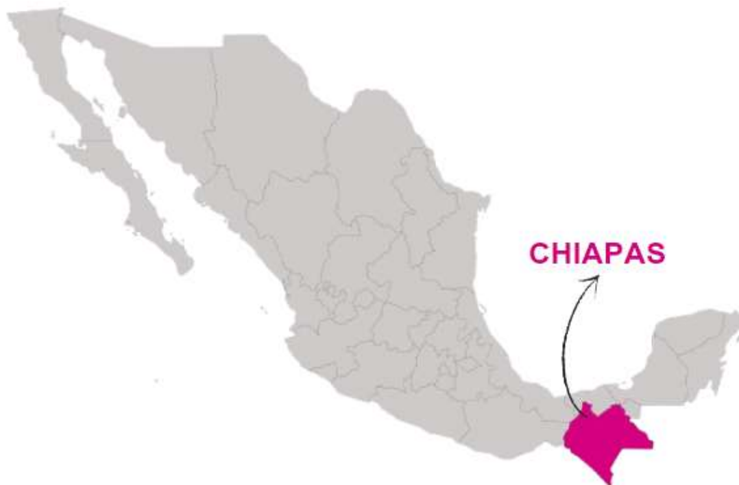
Mapa 1. Estado con elección extraordinaria